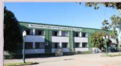
UNIÃO DA VITÓRIA