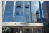
CURITIBA I - EMBAP