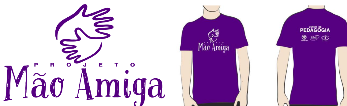
Figura 01: Logomarca e camiseta de identificação do Projeto Mão Amiga