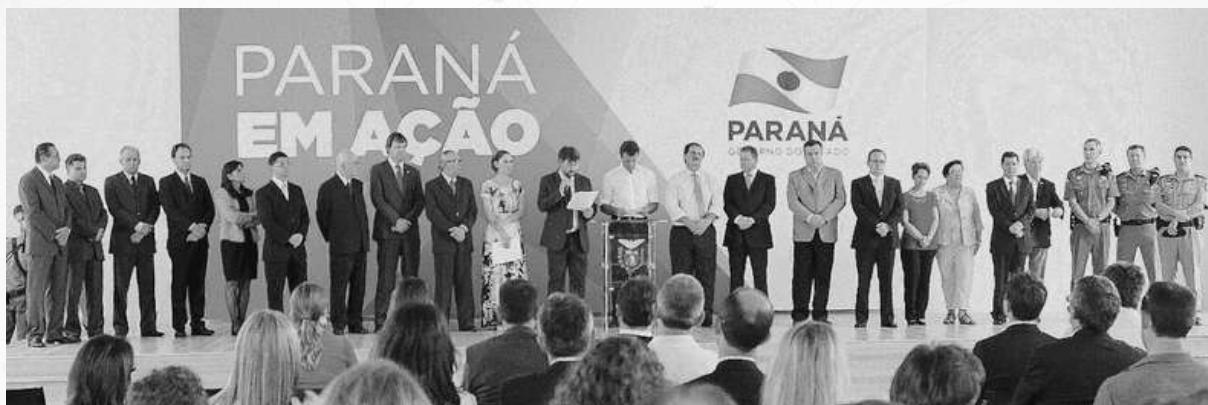
Solenidade de credenciamento da Unespar realizada em dezembro de 2013 no Palácio Iguçu.

As origens da atual Universidade Estadual do Paraná (Unespar) remontam à Lei Estadual nº 13.283, de 25 de outubro de 2001. Tal documento definia a constituição de uma autarquia de mesma designação da atual, composta pelas seguintes instituições de ensino superior: Escola de Música e Belas Artes do Paraná (Embap), Faculdade de Artes do Paraná (FAP), ambas em Curitiba, Faculdade Estadual de Ciências e Letras de Campo Mourão (Fecilcam), Faculdade Estadual de Ciências Econômicas de Apucarana (Fecea), Faculdade Estadual de Direito do Norte Pioneiro (FUNDINOPI), Faculdade Estadual de Educação Física de Jacarezinho (FAEFIJA), Faculdade Estadual de Filosofia, Ciências e Letras de Cornélio Procópio (FAFI-CP), Faculdade Estadual de Filosofia, Ciências e Letras de Jacarezinho (FAFIJA), Faculdade Estadual de Filosofia, Ciências e Letras de Paranaguá (FAFIPAR), Faculdade Estadual de Educação, Ciências e Letras de Paranaíba (FAFIPA), Faculdade Estadual de Filosofia, Ciências e Letras de União da Vitória (FAFIUV).