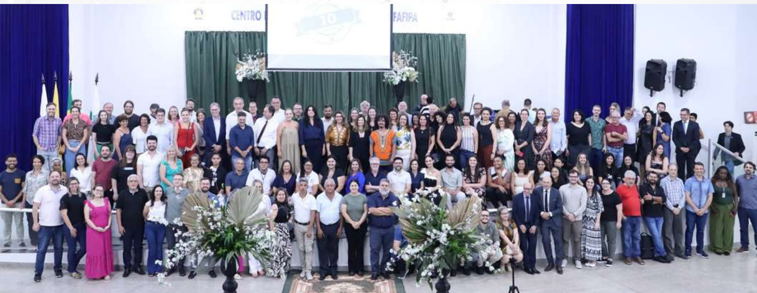
Foto oficial comemorativa dos 10 anos da Unespar.